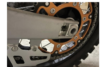
Transmisión a cadena

* Imágenes de carácter ilustrativo. RVM - JAWA ARGENTINA se reserva el derecho de efectuar las modificaciones que considere necesarias en las especificaciones y el diseño de sus motocicletas en cualquier momento. **Los baules laterales y trasero son opcionales.