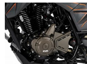
Motor de 249,4 CC refrigerado por aire y radiador de aceite