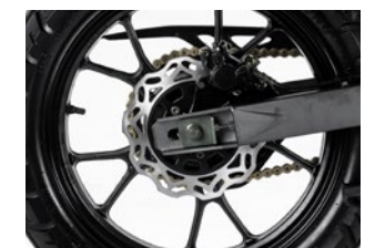
Disco de freno trasero y llantas de aluminio

* Imágenes de carácter ilustrativo. RVM - JAWA ARGENTINA se reserva el derecho de efectuar las modificaciones que considere necesarias en las especificaciones y el diseño de sus motocicletas en cualquier momento. ** Los protectores de manillares y soportes y baules laterales y trasero son opcionales.