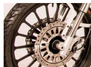
Llantas de aluminio