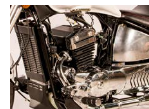
Motor de 320 CC Inyección electrónica