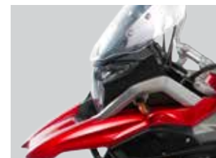
Luces Full LED