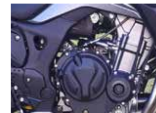
Motor Loncin Doble árbol de levas 8 válvulas